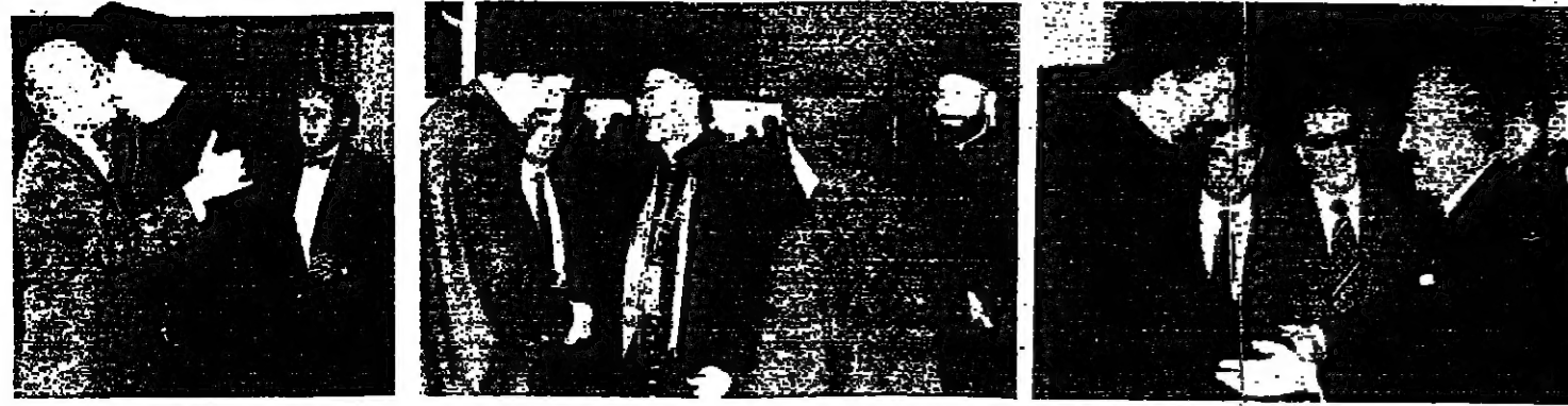
الرئيس كرامي يقدم تهنئة لسماحة الامام الصدر (تصوير محمد حواري) الرئيس كرامي يقدم تهنئة لسماحة الامام الصدر (تصوير محمد حواري) الرئيس كرامي يقدم تهنئة لسماحة الامام الصدر (تصوير محمد حواري)

● هل تعتقد بان الحكومة ستعالج (الجمعة القصية) لغة المجلس؟ □ حتى هذه الساعة، فان الحكومة التيانية التي تجتهد في الحكومة، اللهم الا اذا طرأ اي تحول... ان كان على الصعيد الداخلي او الخارجي... ● ما هو رايك في حالة الين؟ ● ان شاء الله، وفيه الكثير من الجوانب التي ينبغي ان نرى فيها املا، وان كان على الصعيد الداخلي او الخارجي... ● ما هو رايك بالتدخل الثلاثي، وهل يستطيع عمل اي شيء لاستطاع الحكومة وكسب معركته عندما...؟ □ اي تحالف ثلاثي هذا...؟ ● المؤلف من الرئيسين سلام وكرامي والميدان... □ كان هناك في السابق حلف ثلاثي واحد، لكن... شعاعه، وقد كان في مقدوره تخليص البلاد مما تعاقب من... ● وقد خلاصنا من اوضاع مريعة كثيرة.